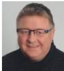
Uwe Fischer Studienzentrum