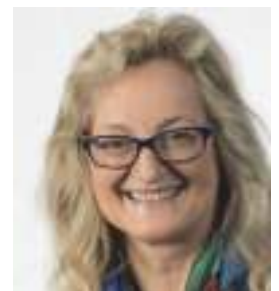
Marion Junck Studienzentrum