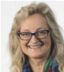
Marion Junck Studienzentrum