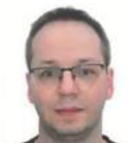
Paul Simon FA Frankfurt