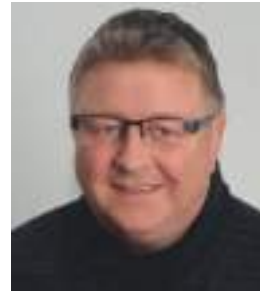
Uwe Fischer Studienzentrum